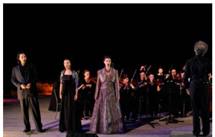
Sextuor «Sola, sola in buio loco...»