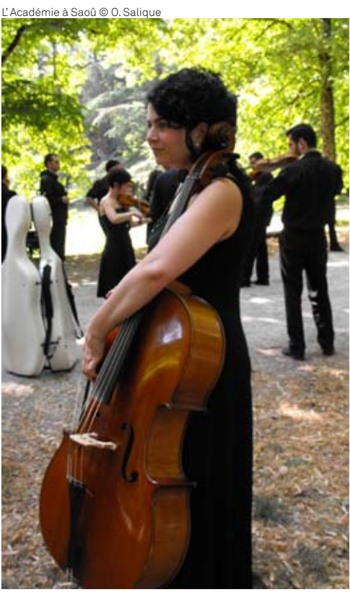
L'Académie à Saoù