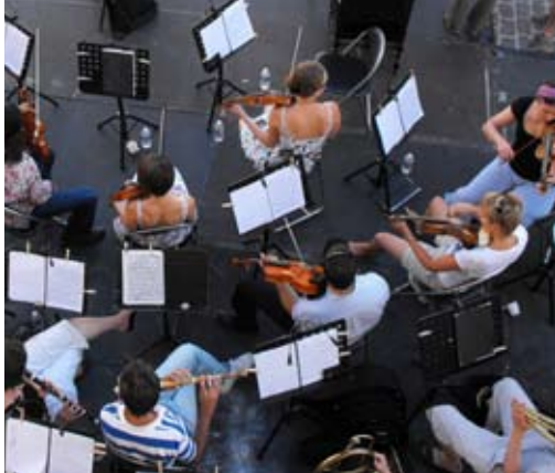
L'Académie à Menerbes