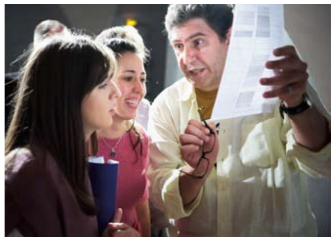
Chanteurs lors du 1 er stage solistes