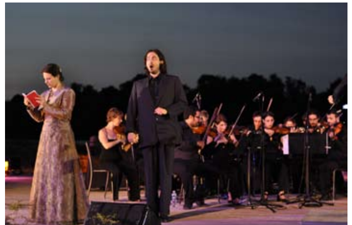
Air de Leporello «Madamina, il catalogo è questo»