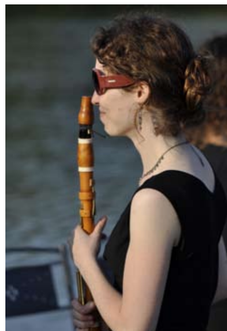
L'orchestre en répétition au Parc des Oiseaux