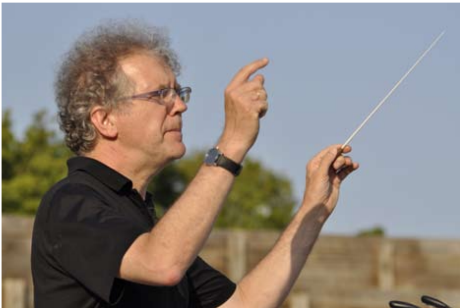
Martin Gester