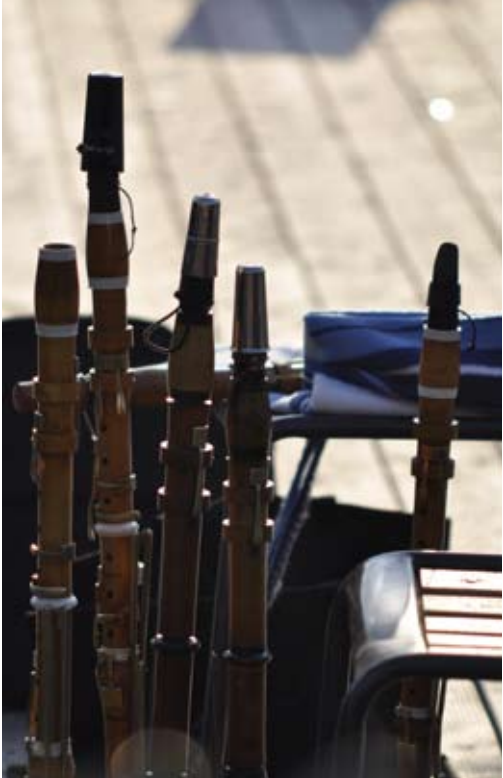
L'Académie à Villars-les-Dombes