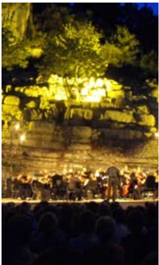
L'Académie à Labeaume