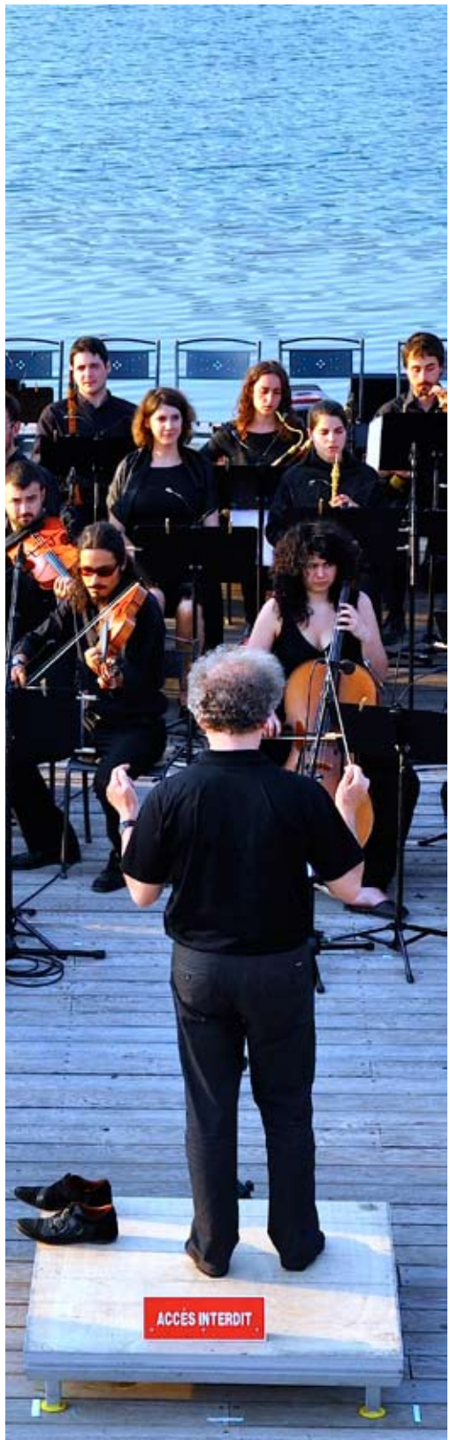
L'Académie à Villars-les-Dombes