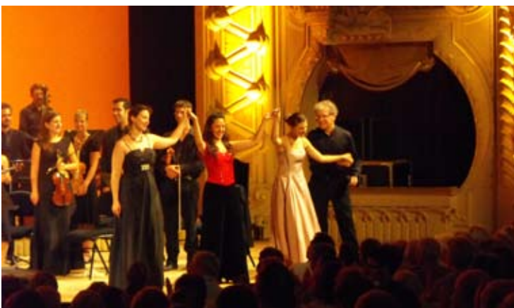
L'Académie à Vichy