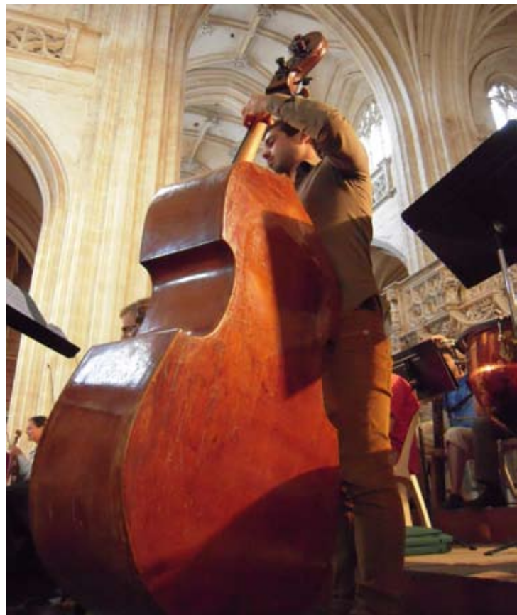
L'Académie à Bourg-en-Bresse