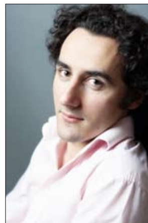
Jean-Gabriel Saint-Martin - baryton-basse