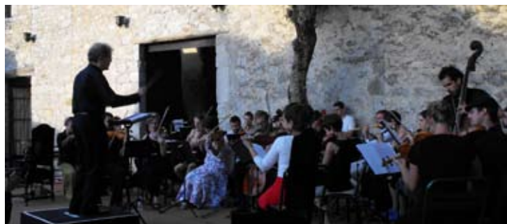
L'Académie à Sisteron

Mercredi 29 juillet, Courchevel, Festival de Tarentaise, 200 spectateurs