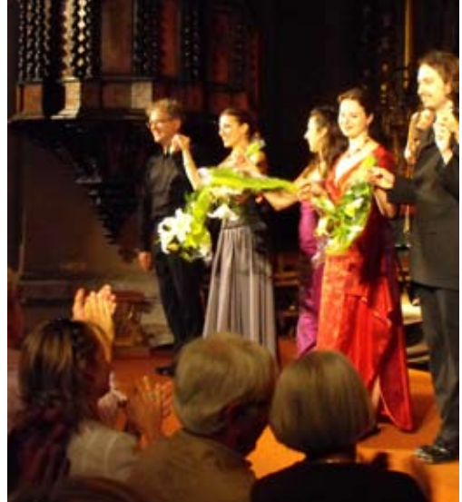
L'Académie à Aime