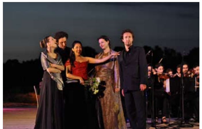
Duo Masetto et Zerlina «Giovinette che fate all'amore»