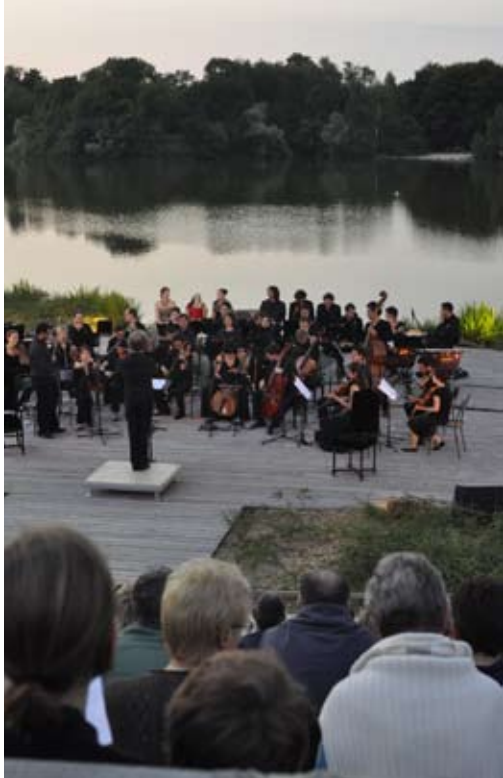
L'Académie à Villars-les-Dombes