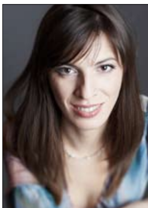
Ina Kancheva - soprano