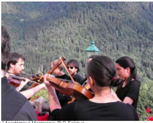
L'Académie à Montsapey