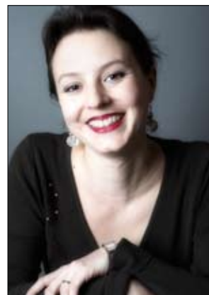
Soanny Fay - soprano