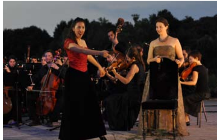
Air de Despina «In uomini, in soldati...»