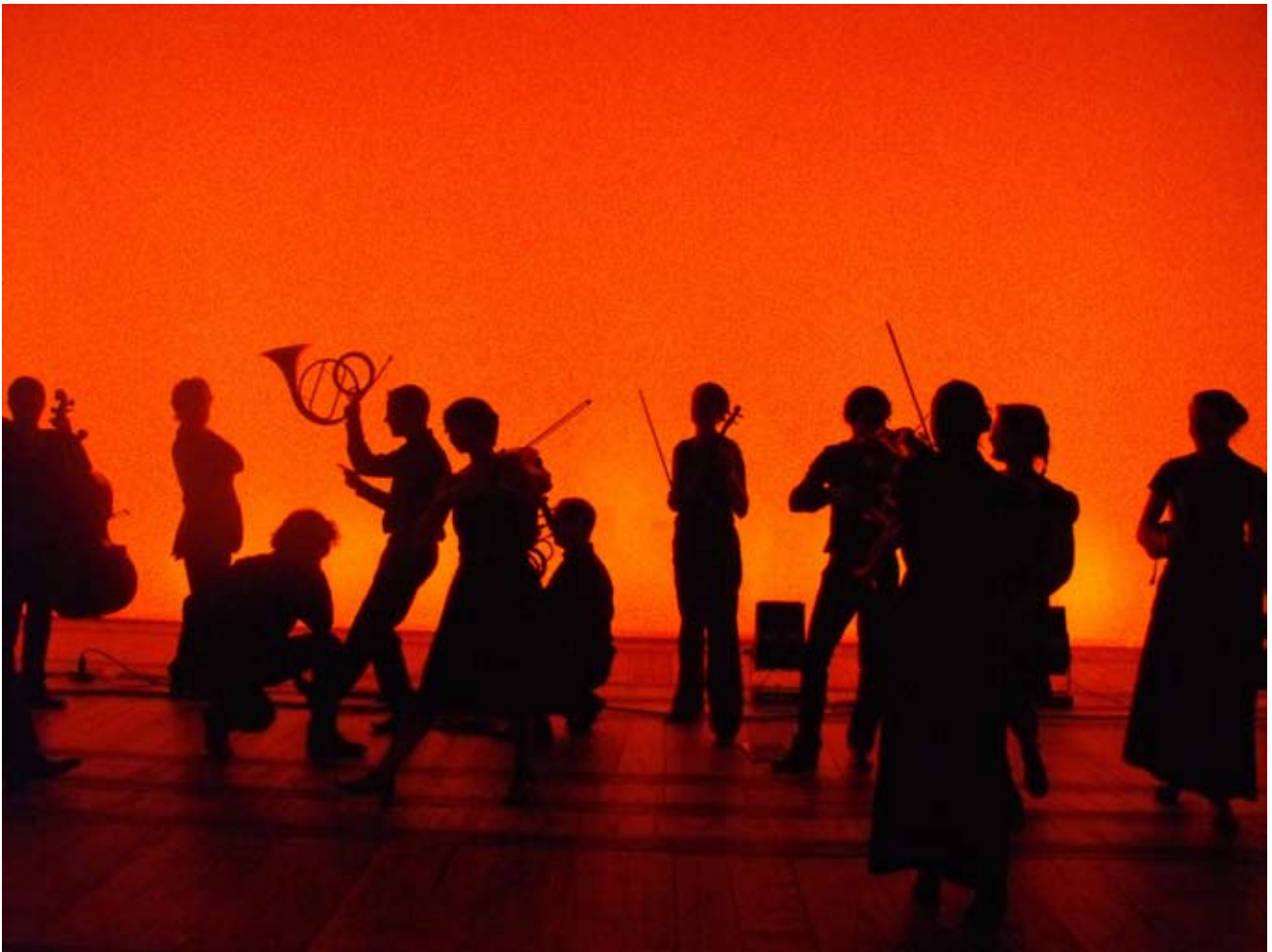
L'Académie dans les coulisses de l'Opéra de Vichy